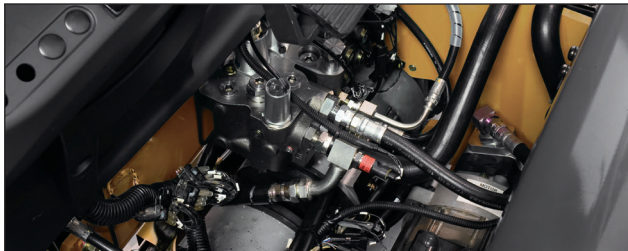
Garantía de fábrica para una mayor protección