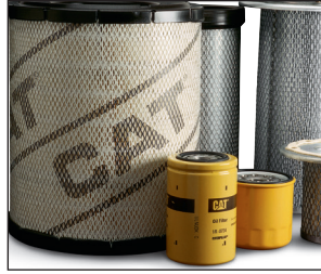
Refacciones genuinas de OEM