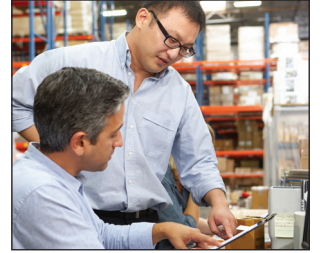
Paquetes de financiamiento a la medida