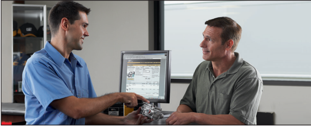
Servicio y soporte local